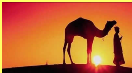
DESERT DEL MARROC